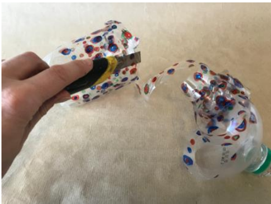
Abbildung 4: Schritt 2 a Windspirale (Ruckriegel/ZBH)