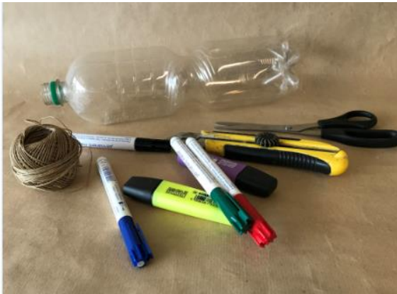
Abbildung 2: Material Windspirale

Dekorativ und super einfach herzustellen.