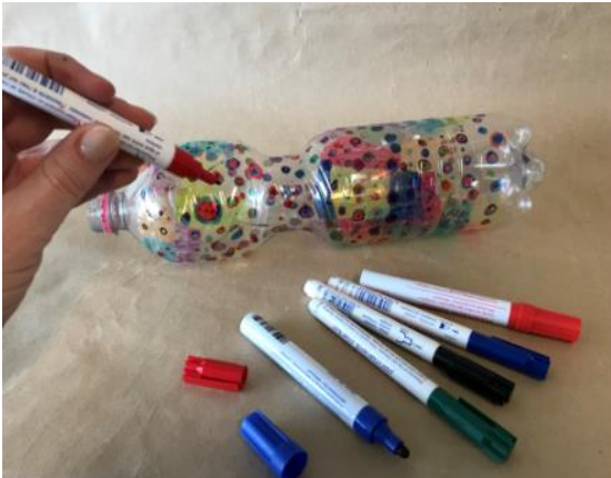
Abbildung 3: Schritt 1 Windspirale (Ruckriegel/ZBH)