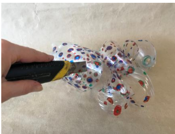
Abbildung 5: Schritt 2 b Windspirale (Ruckriegel/ZBH)

a) Die Flasche vom Hals her spiralförmig einschneiden. Die Spirale sollte ca. 3 cm breit sein.