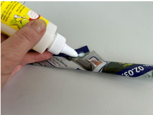
Abb. 6: Schritt 4 , Streifen mit Kleber fixieren