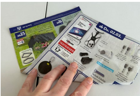
Abb. 4: Schritt 2 , Blätter zu Dreieck falten

Je mehr Blätter Sie haben, desto größer wird die Schüssel.