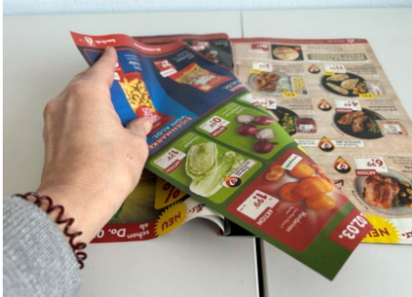
Abb. 3: Schritt 1 , Osterkörbchen aus Zeitungen