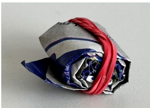
Abb. 8: Schritt 6 , Rolle fixieren

Rollen Sie den ersten Streifen eng zu einer Schnecke.