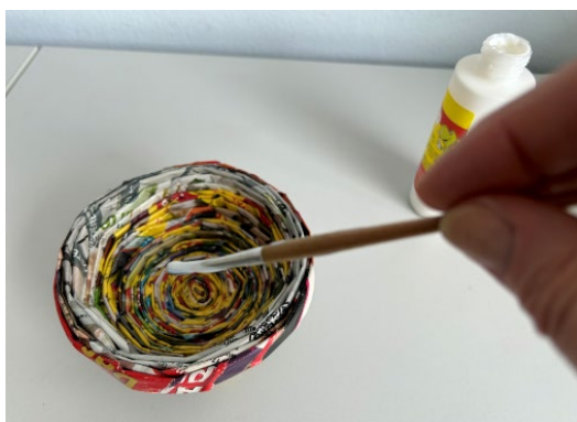
Abb. 9 und 10: Schritt 8 , Schale mit Kleber einstreichen