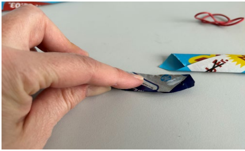
Abb. 9: Schritt 7 , Streifen an Rolle befestigen