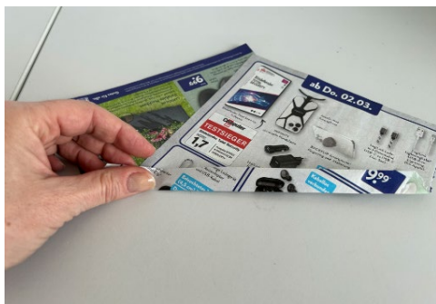
Abb. 5: Schritt 3 , Streifen falten

Achten Sie darauf, dass die eine Ecke etwa 1 cm unter der anderen liegt.