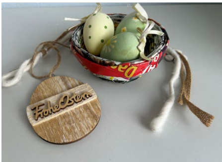
Abb. 1: Osterkörbchen

Schöne Osterkörbchen können Sie ganz leicht aus Werbeprospekten oder alten Zeitungen selbst herstellen. Es kostet quasi nichts, vermeidet Abfall und ist kinderleicht. Ein Bastelspaß für die ganze Familie.